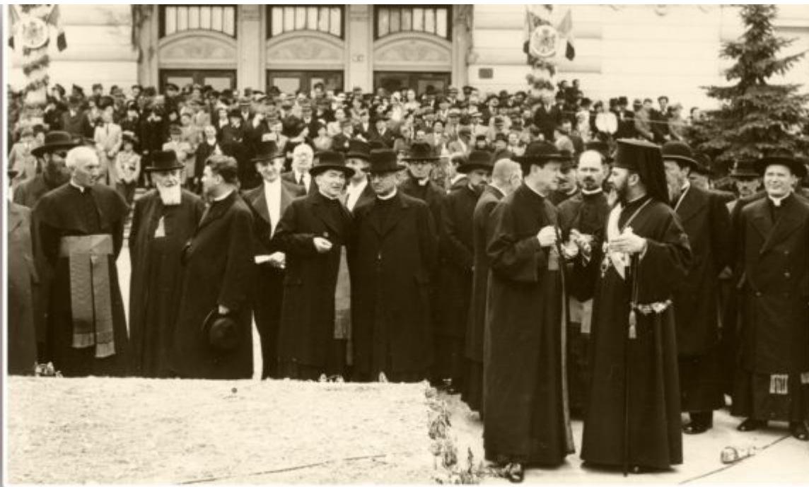
Episcopul Iuliu Hossu la o adunare publică în fata Teatrului National. Cluj

primarie sa solicite acest lucru. Preotilor, insa, li se rezervase altceva. Marturia unui slujitor al Domnului este edificatoare in acest sens. „M-au chemat la Pretura. Inchipuindu-mi de ce era vorba, mi-am salutat familia ca si cum n-as mai fi sperat sa-i vad. La Pretura am intalnit pe alti preoti care fusesera chemati pentru acelasi motiv. Ne-am sfatuit si ne-am hotarat sa purtam mai bine crucea lui Hristos decat funia lui Iuda. Agentii Guvernului ne-au amenintat ca o sa ne alunge din case, ca o sa ne ia bunurile, sa ne vare in temnita si sa ne tortureze. Unii au inceput sa planga, spunand ca o sa se mai gandeasca. Eu am spus ca eram absolut hotarat sa nu-mi lepad credinta. Un frate spuse pretorului ca daca si-ar lepada credinta ar innebuni. Pretorul i-a raspuns: <<Mai intai iscaleste si apoi du-te si te spanzura. Noi n-avem lipsa de popi!>>. In sfarsit, ma lasara sa plec, cu conditia ca sa nu numesc pe papa la liturghie. Cand am spus ca asta era cu neputinta, pretorul a inceput sa injure numele Papei. Dupa ce m-au facut sa promit ca cel putin n-o sa predic, mi-au dat drumul. Cand am ajuns in sat, un credincios m-a instiintat ca inaintea casei mele se gaseau trei masini de la politie. In noaptea aceea am dormit la un prieten.