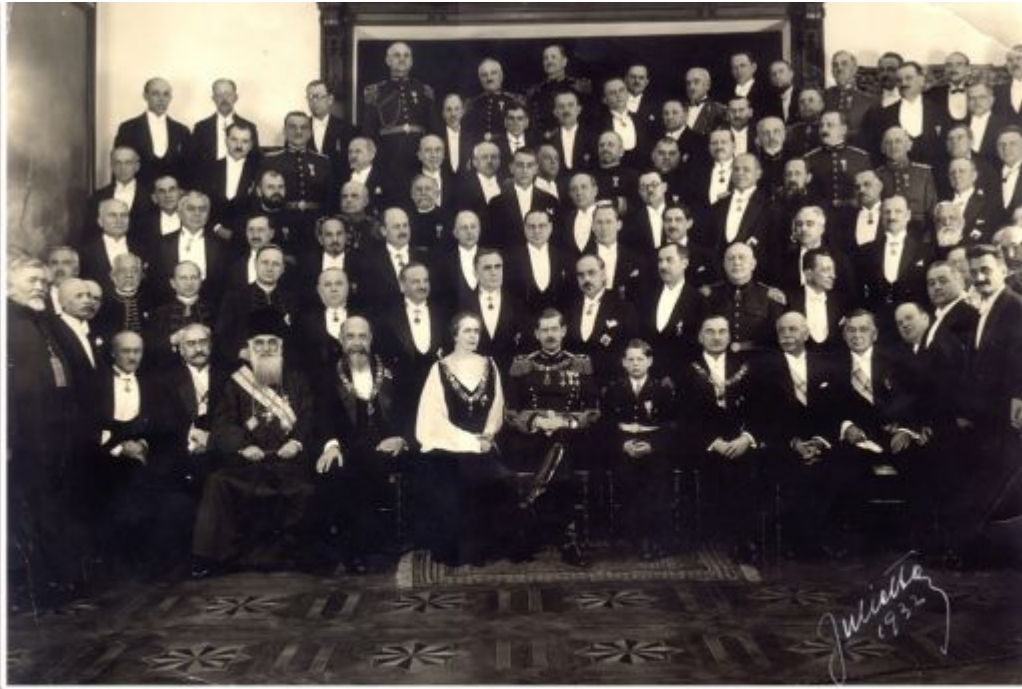
1932, ÎNTĂLNIREA CAVALERILOR ORDINULUI FERDINAND I ALEXANDRU VAIDA-VOEVOD, PATRIARHUL MIRON CRISTEA, NICOLAE IORGA, REGINA MARIA.

Acelasi sfarsit tragic l-a avut si episcopul Ioan Suci, care a murit la 27 iulie 1953, la Sighet. Desi bolnav de ulcer, el nu a primit niciun ajutor medical. Trupul neinsufletit a fost aruncat intr-o groapa comuna din cimitirul saracilor de pe malul Izei. Episcopul a fost arestat in octombrie 1948, dupa ce cordoane de soldati au incercat sa-i blocheze intrarea in catedrala din Blaj, insa multimea de credinciosi veniti la Casa Domnului i-au inlaturat. Dupa predica insa, a fost arestat si aruncat intr-un beci, unde timp de doua zile a fost tinut fara apa si fara mancare. Ulterior, a fost eliberat si arestat din nou si inchis intr-o celula alaturi de episcopii Vasile Aftenk, Iuliu Hossu si Alexandru Russu. De aici, a fost dus la Dragoslavele, Caldarusani si la Ministerul de Interne. In septembrie a fost inchis la Sighet, unde a si murit.